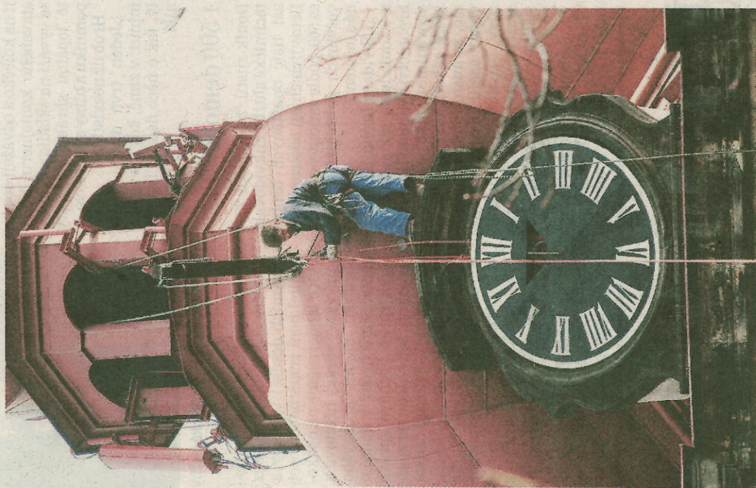
UŽ JE NA SVĚM MÍSTĚ. Včera proběhla instalace ciferníku na kostele sv. Petra a Pavla v Jeníkově.